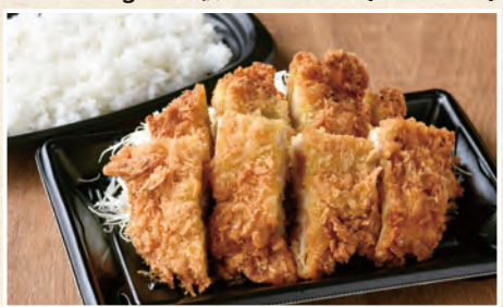
ジャンボチキンかつ弁当