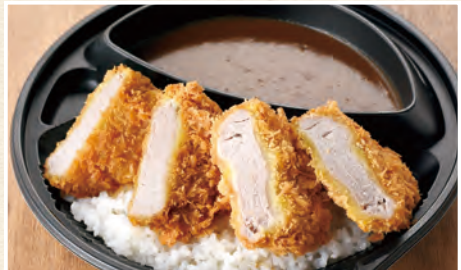
ヒレかつカレー弁当

(梅)90g ロース / 880円(税込950円) (竹)120g リブロース / 980円(税込1,058円) (松)170g リブロース / 1,180円(税込1,274円)