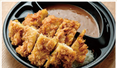
ジャンボチキンかつカレー弁当